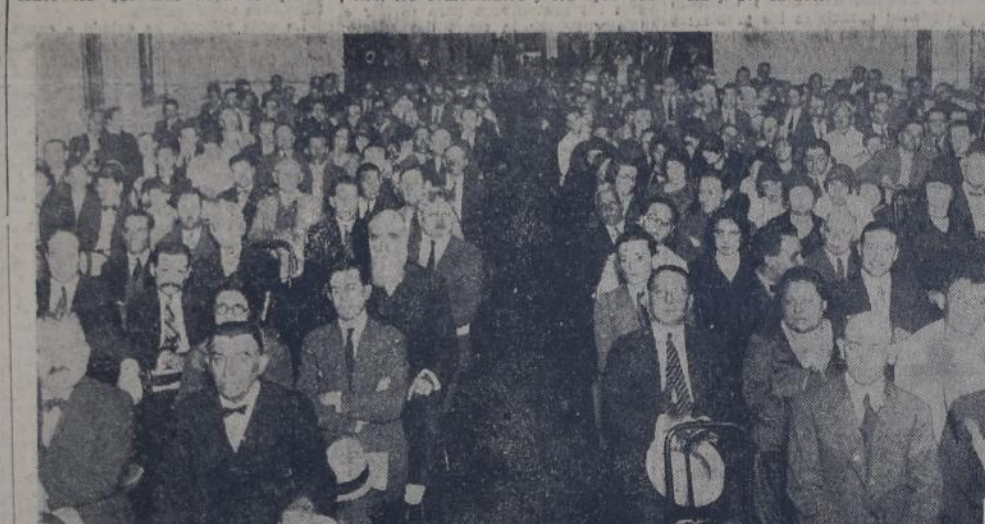
VISTA DEL PUBLICO QUE ASISTIO AL ACTO DE ANOCHE EN LA CASA DEL PUEBLO

Justo aspiraba a hacer de la política una actividad inteligente y honesta al alcance de todos los hombres. El ha puesto su vida entera al servicio de este gran ideal: pero su vida no ha bastado, como no bastará la nuestra, para realizar tan alto pensamiento. Generaciones y más generaciones habrán de completar la obra que sólo para su esbozo requirió los esfuerzos de un titán de la inteligencia y del carácter.